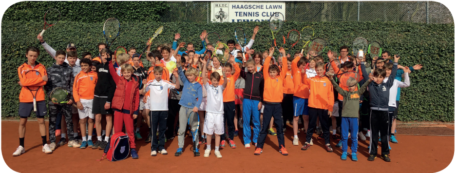
Grote groep jeugdspelers genoten van clinic van topselectie

We ondersteunen de jeugd in de breedte zoals het sponsoren van de bus naar het ABN AMRO toernooi en de Tennis Academie.